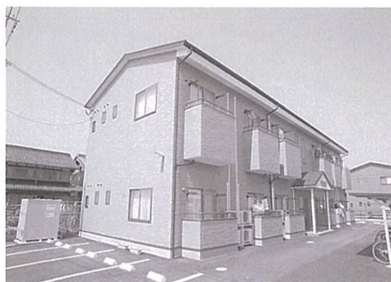
●バイオ・コーポ斡旋の「学生マンション」