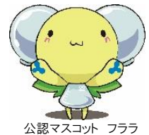
公認マスコット フララ

バイオ実験・実習プログラムでは、大学の先生や在学生と一緒に実験を体験して、大学の雰囲気を知ることができます。バイオ実験・実習は6つのプログラムをご用意しており、定員を設けているため、事前に参加申込みをお願いしています。当日の参加も可能ですが、定員に達したプログラムにつきましては受付を締め切らせていただきます。希望するプログラムに必ず参加をしたい方は事前にお申込みください。