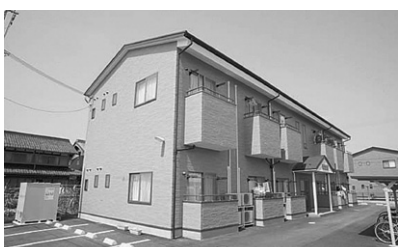
●バイオ・コーポ斡旋の「学生マンション」