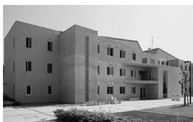
●大学隣接の「国際交流ハウス」