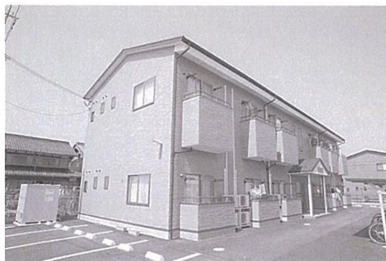
●バイオ・コーポ斡旋の「学生マンション」