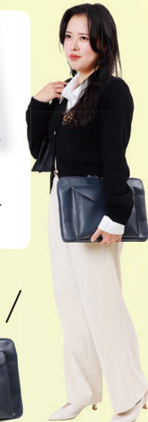
アニマルバイオサイエンス学科 古田 明日香先生