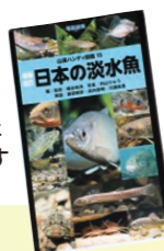
アニマルバイオサイエンス学科 4年次生 アイメ パトリックさん