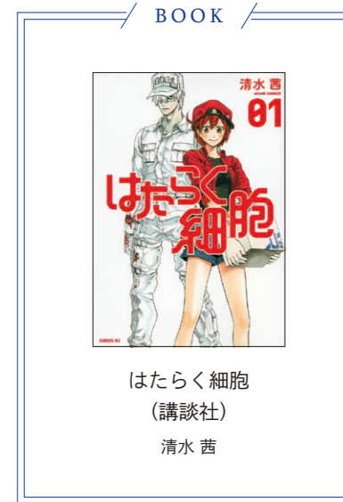
はたらく細胞 (講談社) 清水 茜

臨床検査技師で専門は超音波検査。呼吸機能、心電図、超音波検査、脳波などを学ぶ「臨床生理学」などを担当している。