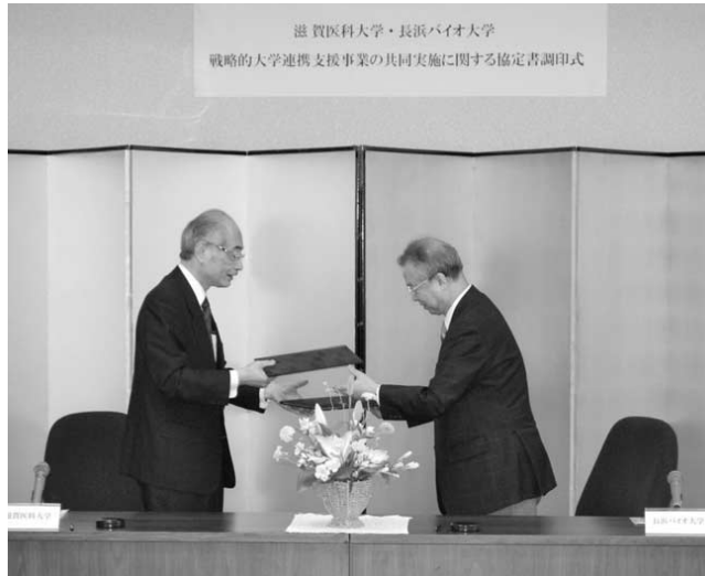
滋賀医科大学との大学間連携協定の調印式

交互に会場を変えながら、日韓学生交流を毎年開催している。長浜バイオ大学の大学院生を中心とした研究成果の発表と、交流を通じてグローバル化時代に応える国際感覚と、世界に通用する人材育成に役立っている。