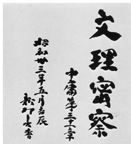
1958年の学院創立記念に際して、関西文理学院創立者の一人、新村出先生の揮毫

②また学園時代の「生徒が主人公」の精神は、当初、地方出身の入学希望者への下宿斡旋に始まる生徒への生活相談として具体化された。さらにクラス制の導入とホームルームアワーを通じての集団的な学習・生活指導によって、生徒が互いに励ましあって成長する場を保証したり、また学習進学相談室における専任の担任による個人相談など、あくまでも生徒の立場に立って進学への希望を実現する取り組みは、他の予備校の注目を集め優れたモデルとなった。