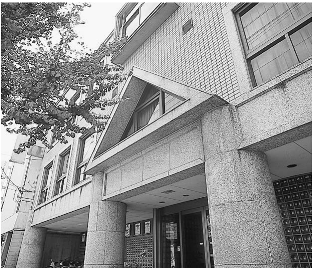
留学生たちのニーズに応えた「国際進学教育学院」

しかし、入国管理行政の規制強化等のしわ寄せを受けて募集が振るわず、短命に終わった(実質6年間)。本コースの開設は国際化時代に役立つ人材育成をめざす学園の理念を、実際の教育に活かしたものであり、その後開学した長浜バイオ大学に、その経験が引き継がれていた。