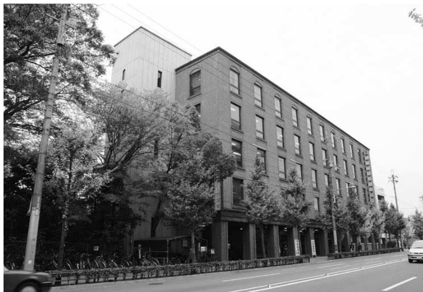
ユニークさが注目された専門学校バイオカレッジ京都