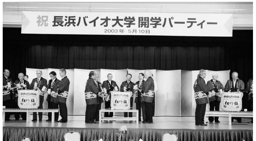
開学パーティーには地元・各界から400人が参加 開学時には海外を始め全国から見学者が訪れた