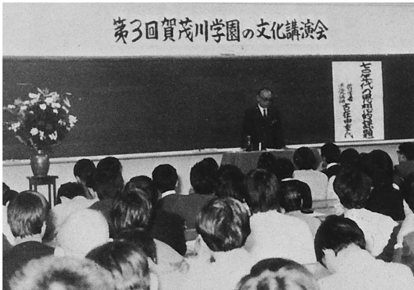
各界の多彩な講師による文化講演会（1970年）