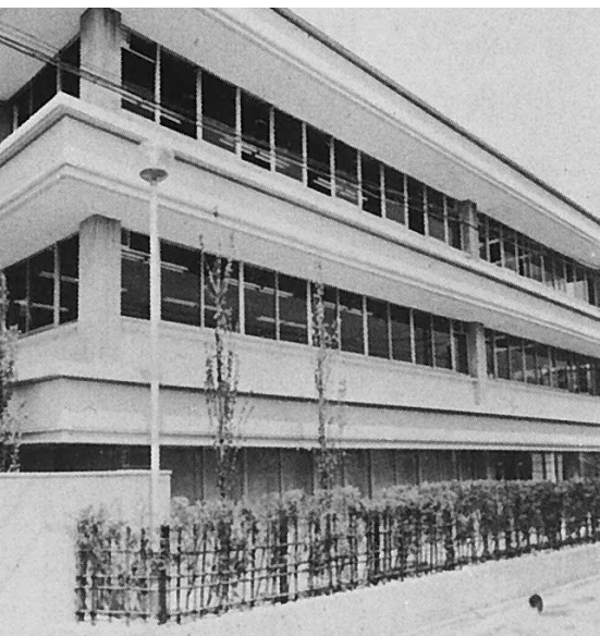
烏丸鞍馬口校舎の1号館の全景

ところが、主として勤労者向けの「夜間部」(1949年から夜間1年制に移行)のみの講義となっていた人文学園の方は、学園事業を続けていくことが益々、困難になっていた。運