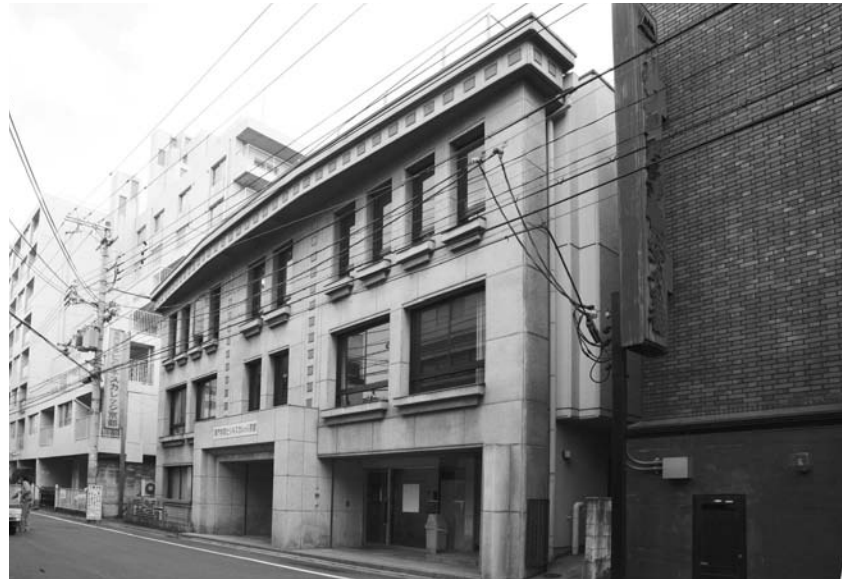
再スタートを切った専門学校ビジネスカレッジ京都

遼寧分校）から留学生を受け入れたことにより、わが国の専門学校では先駆的な国際コースとなった。環日本海経済交流の発展を視野に入れた、期待の新設コースであり、1998年4月には一年制の専攻科も設けた。入国管理をめぐる厳しい規制等で、留学生の確保が年ごとに難しくなり、実質10年間で、当該コースを閉じざるを得なくなつたが、受け入れた留学生は総数で100名を超えた。