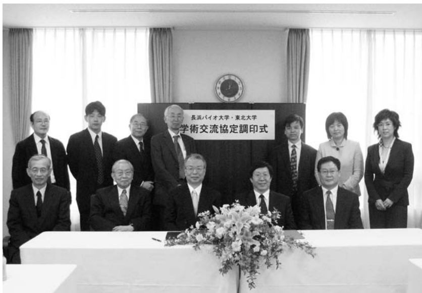
中国・東北大学との学術交流協定の調印式

どまらず、「人文・言語系」の多様な教育事業にも新しく着手していくことを視野に入れ、人文学園創立以来の総合的な教育課題に応える、学園事業の実現をめざしていくことにしたい。国際的な規模（中国・東北大学などと連携）で展開していく、未来志向の戦略構想を描いていくことも重要な課題になっている。