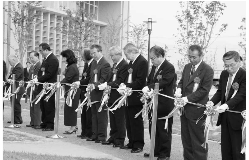
地元市民をはじめ150人が参加するなど熱い期待をあつめた開学フェスティバル 湖北1市12町に町から寄贈された「湖国の森」でテープカット